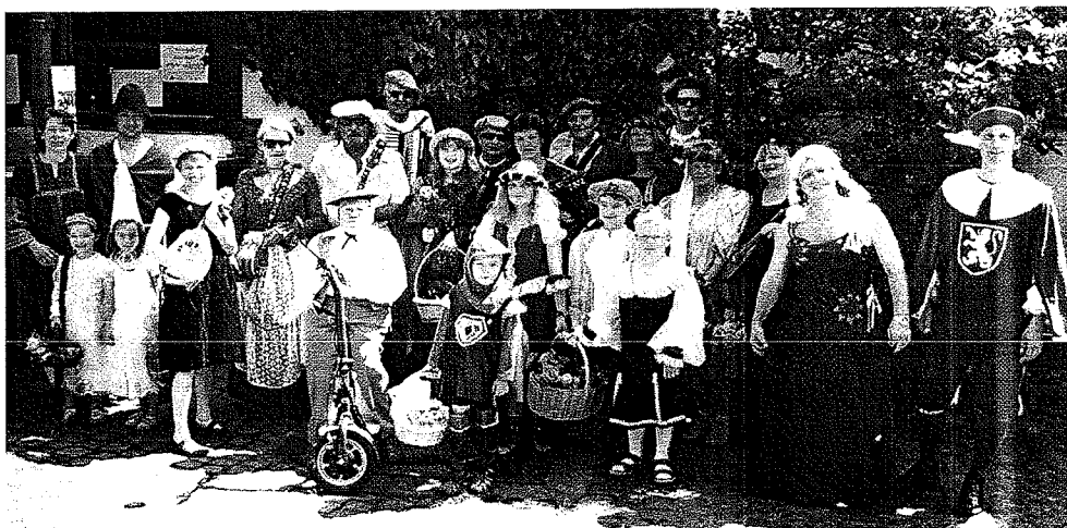
MFN - Fußgruppe „Rapunzel „